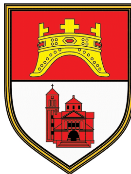
Grb grada Tomislavgrada

Počinjemo s uređenjem natpisa na zidu župne kuće i s postavljanjem grbova hrvatskih gradova na krovu . Zaključili smo sponzorstvo za grbove hrvatskih gradova na krovu župne kuće. Javilo se 20 sponzora za grbove Nove Gradiške, Ljubuškoga, Osijeka, Zagreba, Požege, Imotskoga, Varaždina, Siska, Petrinje, Gospića, Rijeke, Vukovara, Bjelovara, Splita, Ogulina, Šibenika, Zadra, Dubrovnika, Mostara i Tomislavgrada . Svaki grb i pripadajuća kon-