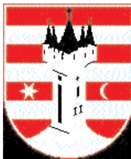
Grb grada Varaždina

Počinjemo s uređenjem natpisa na zidu župne kuće i s postavljanjem grbova hrvatskih gradova na krovu . Zaključili smo sponzorstvo za grbove hrvatskih gradova na krovu župne kuće. Javilo se 20 sponzora za grbove Nove Gradiške, Ljubuško-ga, Osijeka, Zagreba, Požege, Imotskoga, Varaždina, Siska, Petrinje, Gospića, Rijeke, Vukovara, Bjelovara, Splita, Ogulina, Šibenika, Zadra, Dubrovnika, Mostara i Tomislavgrada . Svaki grb i pripadajuća konstrukcija stajat će 1,000.00 $. Molimo sponzore da slijedećih dana predaju novac za sponzorstvo (u gotovini ili čekom). Pojednim darovateljima (osim kompanija i udruga) sponzorstvo se računa kao njihov doprinos za crkvu. Izbor grbova na krovu župne kuće znak je iz kojega kraja su (sadašnji ili prijašnji) župljani župe Toronto. Grbove i imena sponzora napisat ćemo na posebnu ploču i postaviti u crkvi. Hvala župljanima koji su do sada dali svoj prilog za dizalo - ovaj korisni projekt za cijelu zajednicu koji je vezan uz vrijednost koja trajno ostaje kao pomagalo starijim osobama u njihovom lakšem pristupu dvorani i crkvi kao i lakšu dostavu prehrambenih namirnica, pića i ostale dostave koju neće trebati nositi po stubama. Molimo vas da svoje priloge za dizalo ne stavljate u milostinju , jer se onda računaju kao milostinja, nego predate u ured ili gospođama koje upisuju mise. Do sada