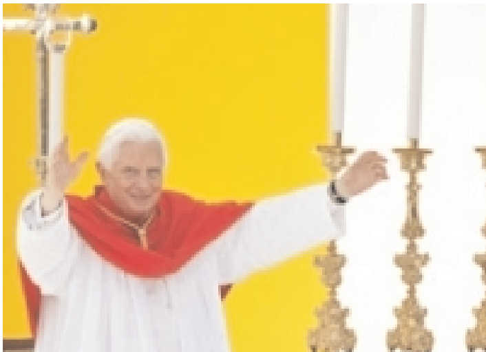
Papa Benedikt XVI.